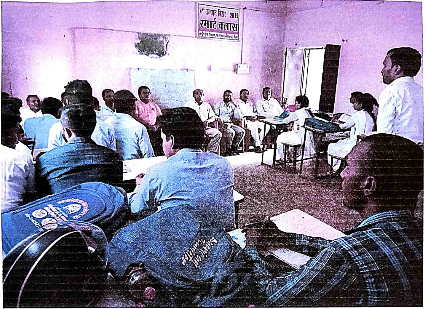
Introduction Class (शिक्षक और प्रशिक्षक डेवीय)